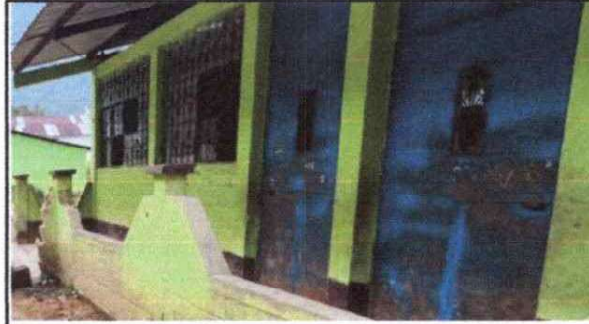
Foto 8: Mejoramiento de puertas y ventanas debido al deterioro de las mismas (modulo 3).