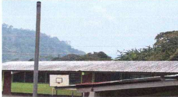
Foto 2: Mejoramiento de techo ya que se observa la acumulación de partículas inadecuadas que deterioran las laminas (modulos 2, 3 y 4).