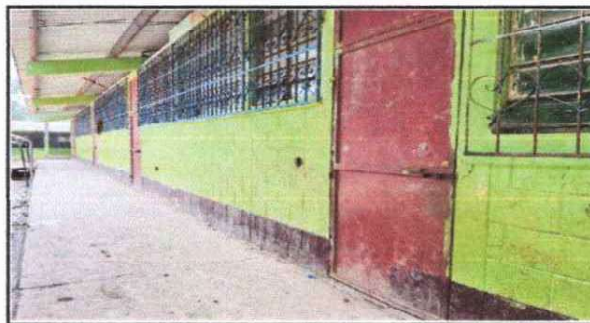
Foto 6: Mejoramiento de pintura por deterioro mas zocalo por deterioro de la misma (modulos 2, 3 y 4).

Observación: Si es necesario se pueden agregar hojas adicionales y actualizar el número de hojas.