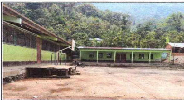
Foto 5: Mejoramiento de pintura por deterioro mas zocalo por deterioro de la misma (modulos 2, 3 y 4).