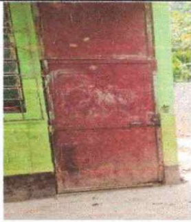
Foto 9: Mejoramiento de puertas debido al deterioro de las mismas.

Observación: Si es necesario se pueden agregar hojas adicionales y actualizar el número de hojas.