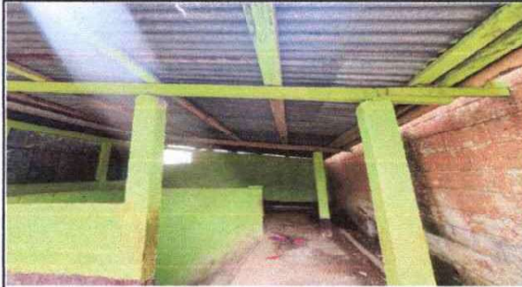
Foto 7: Sustitución de estructura de madera por metalica y cambio de laminas para evitar riesgos por deterioro.