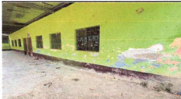
Foto 4: Mejoramiento de pintura exterior mas zocalo por deterioro de la misma (modulos 2, 3 y 4.)