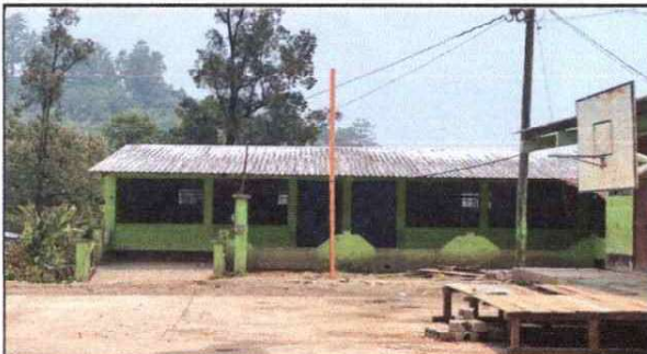
Foto 3: Mejoramiento de techo por acumulación de partículas inadecuadas que deterioran la vida útil de las laminas (modulos 2, 3 y 4).