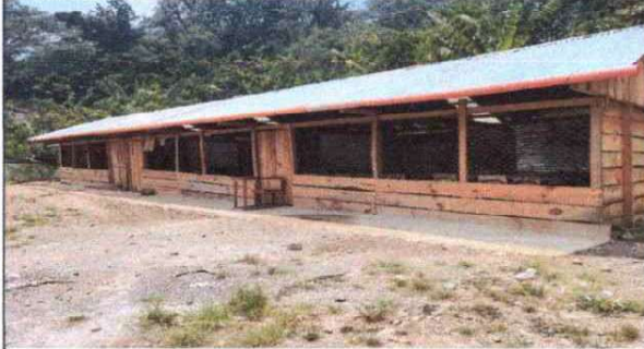
Foto 1: Mejoramiento modulo 1, compuesta de dos aulas para comodidad y seguridad de los estudiantes.